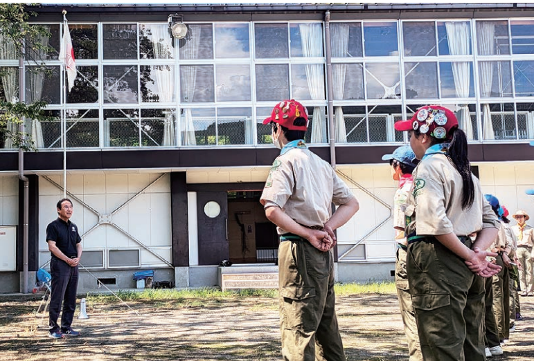
↑開会式では安中市の岩井均市長からご祝辞をいただきました。