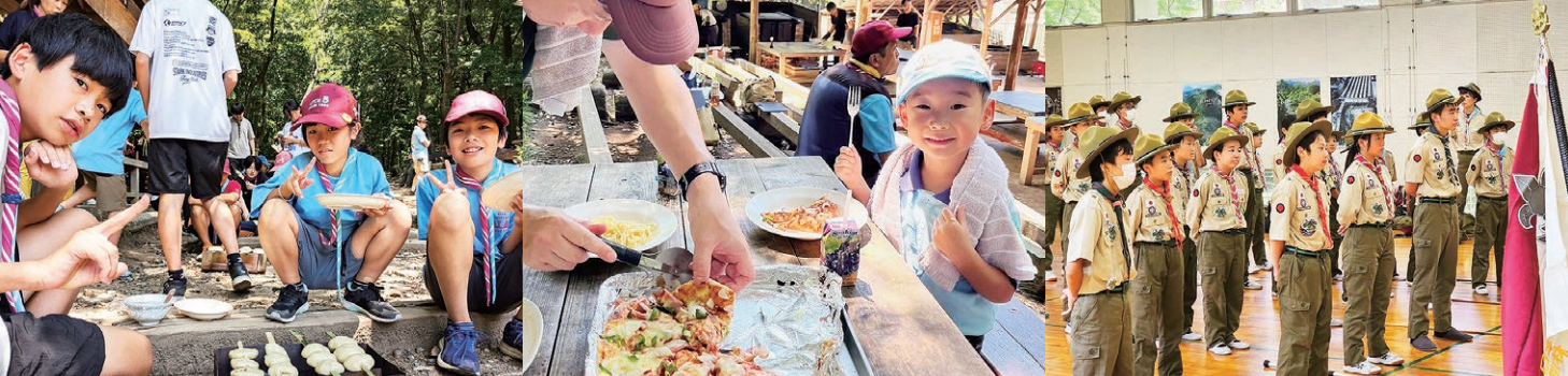
↑太田地区野営大会で行われた各プログラムの様子