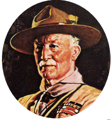
ボーイスカウトをつくった人 ベーデン・パウエル卿

令和5年1月10日 第7号 発行 ボーイスカウト 高崎地区協議会 編集 会員拡充委員会