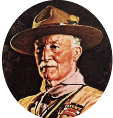
ボーイスカウトをつくった人 ベーデン・パウエル卿

令和7年1月10日 第15号 発行 ボーイスカウト 高崎地区協議会 編集 会員拡充委員会