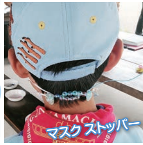
マスクストッパー

活動に不可欠となったマスクを少しでも楽しむため、マスクストッパーを手作りました。