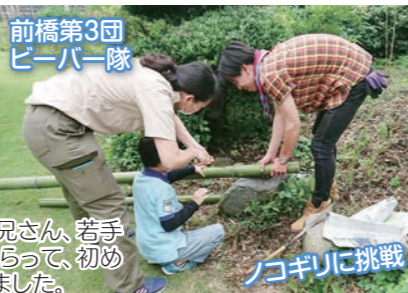
前橋第3団 ビーバー隊

上毛電鉄に自転車を乗せて、西桐生駅から足利の織姫神社まで片道18kmの行程をサイクリングしました。スカウトたちはとても元気で、暑さにもコロナにも負けません。