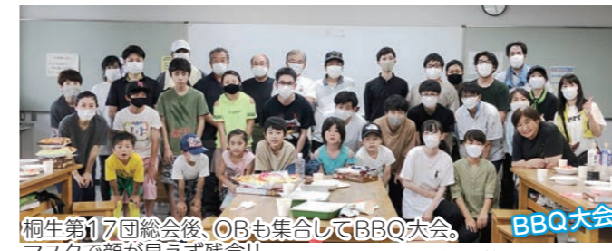
桐生第17団総会后、OBも集合してBBQ大会。マスクで顔が見えず残念!!