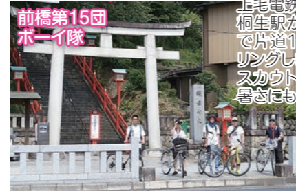
前橋第15団 ボーイ隊

ローパースカウトのお見さん、若手副長にお手伝いしてもらって、初めてのノコギリ体験をしました。