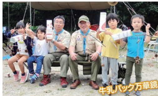
牛乳パック万華鏡