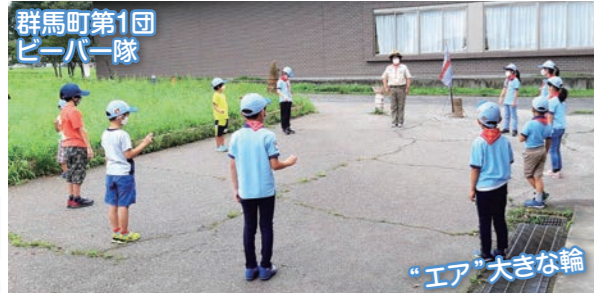
群馬町第1団 ビーバー隊

集会直前まで土砂降りでしたが、雨止がりの吾妻公園を散策。いろいろな生き物や花に出会いました。