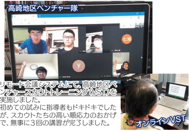
高崎地区ベンチャー隊

2級スカウト章進級の総仕上げ「10キロハイキング」仲間と成し遂げる充実感はかけがえないもの。班が成長していくのを実感します。マスクとも上手に付き合っているスカウトたちです!