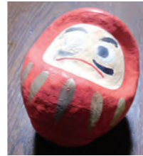
5か所の顔パーツをそろった達磨

今回のカブラリーでは、「巻物」(指示書)の課題をこなしながら高崎市役所周辺にある5つの「陣地」(ポイント)をまわって各ゲームをクリアし、クリアするとスタンプラリー台紙となる「ミニ達磨」に顔のパーツを描き込んでもらってそろえていく、という流れで実施しました。参加スカウトは事前に団や組ごとに製作した甲冑や忍者の装束に身を包み、訓練したロープや計測の技能を發揮しながら各ゲームや指示書の課題に挑戦しました。閉会式では優れたデザインの衣装を披露してくれた団・組を表彰しました。