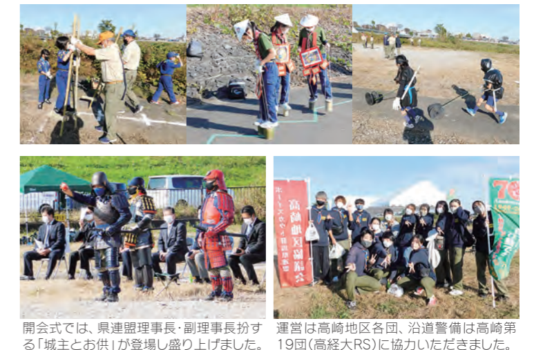
閉会式では、県連盟理事長・副理事長扮する「城主とお供」が登場し盛り上げました。運営は高崎地区各団、沿道警備は高崎第19回(高経大RS)に協力いただきました。

本陣その他 《サブゲームコーナー》 本陣(セレモニー会場)や各陣地では、メインのゲームのほか、竹馬や竹ぼっくり、たが回し、巨大神経衰弱、ロープゲームなどのサブゲームも用意しました。メインゲーム以上に熱中するスカウトも見受けられました。